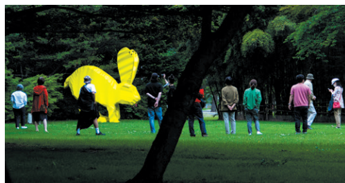
"SRR." 2019

みなとみらい線「日本大通り」駅 3番出口すぐ JR根岸線「関内」駅 南口 徒歩5分 横浜市営地下鉄「関内」駅 徒歩5分 問い合わせ=GALLERIE PARIS (Yokohama) Tel. 045-664-3917