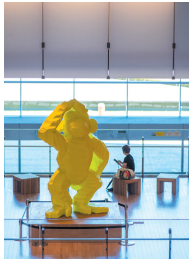
"FFC." 2021 (SUMMER ART ZOO 2021 東京ミッドタウン)