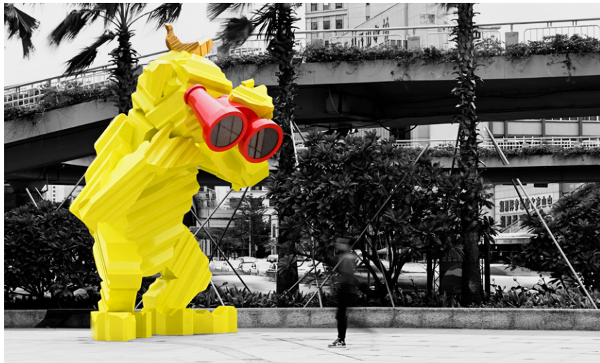
"Find Our Happiness" 2021 (ZHONGSHAN, CHINA)

鉄筋コンクリート造である旧三井物産ビルの一画。日本の近代化の象徴であるこのビルを舞台にWA!moto.の考えるパブリックアート、ヒューマンスケール、そして幸福観について体感できる展覧会です。空想の中から生み出された大きな彫刻が、自在に融合されたデジタルとアナログによって、現実世界に出現するまでのプロセスをぜひ体験ください。会期中は、WA!moto.の大型彫刻が子供達のディレクションで街中を移動するワークショップや、朗読劇などの開催も予定しています。