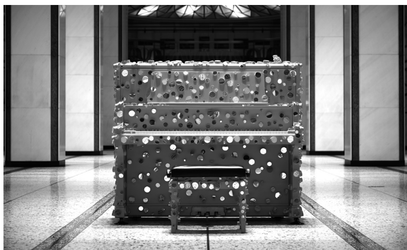
「MPM」2018 (伊達市寄贈予定作品)